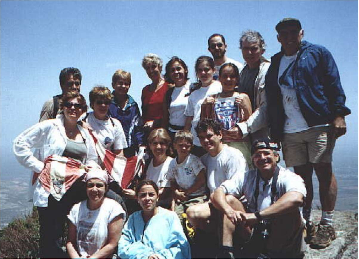
En la cumbre del Cerro Santa Ana