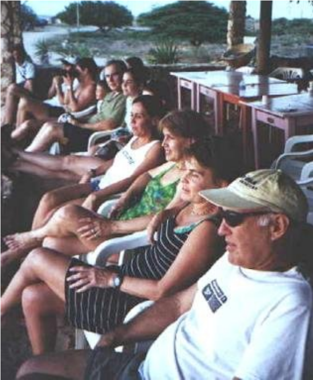
Viendo el atardecer en el Cabo San Román