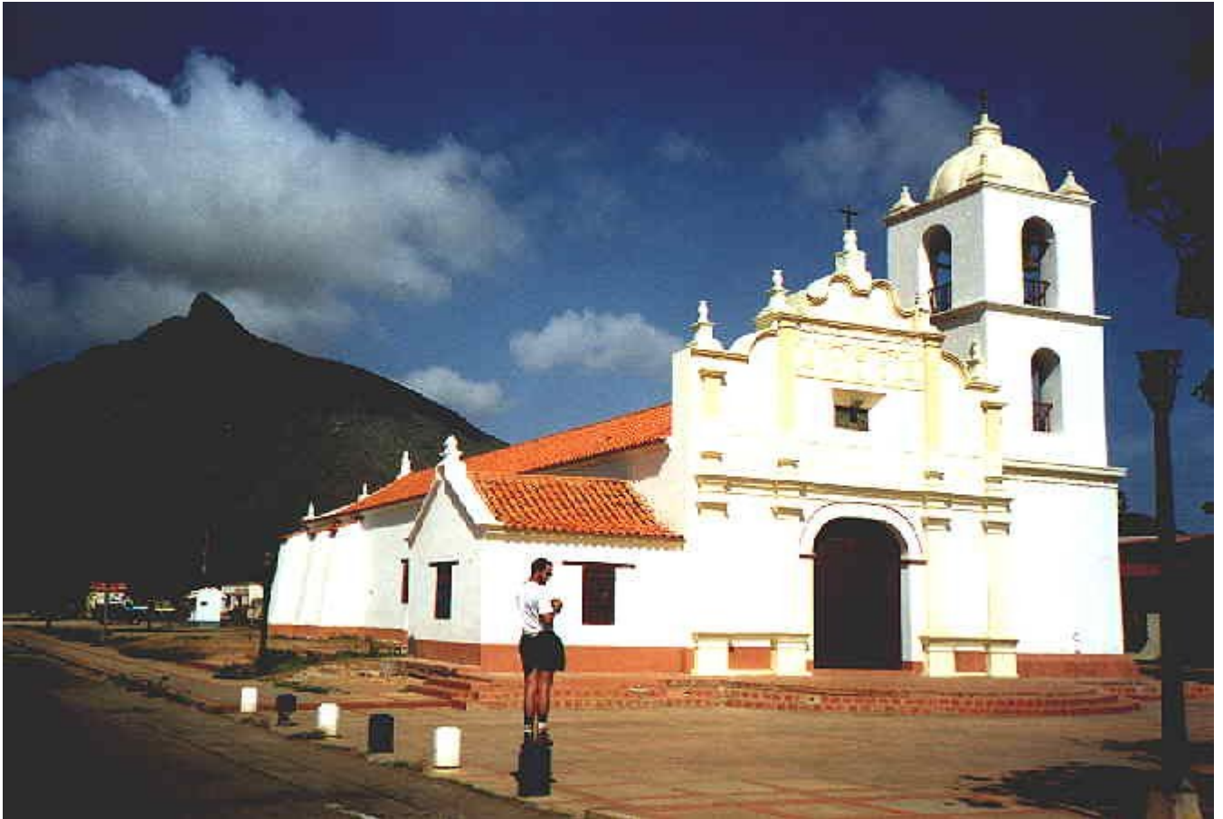
Cerro Santa Ana visto desde Moruy