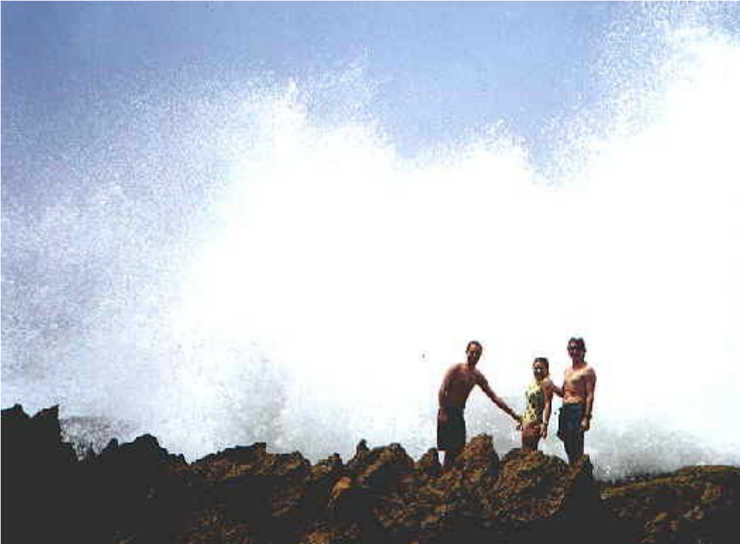
En el rompeolas