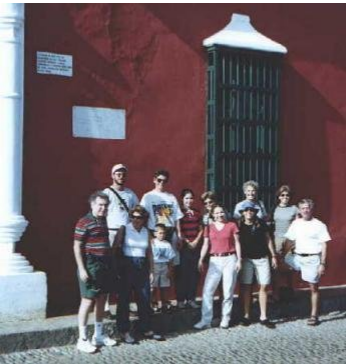
En el casco colonial de Coro