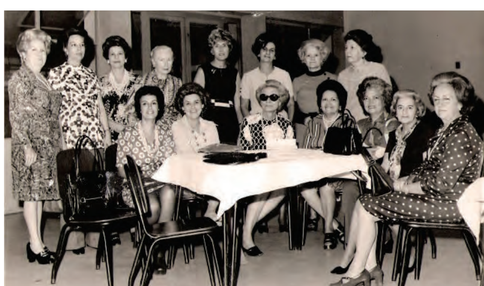
Pioneras de OSCASI, 1958

En 1992 funda la primera Escuela Alternativa llamada "Acción Educativa". Hoy en día lleva adelante cuatro escuelas alternativas, un preescolar y un dispensario odontológico del que se benefician cerca de 400 estudiantes.