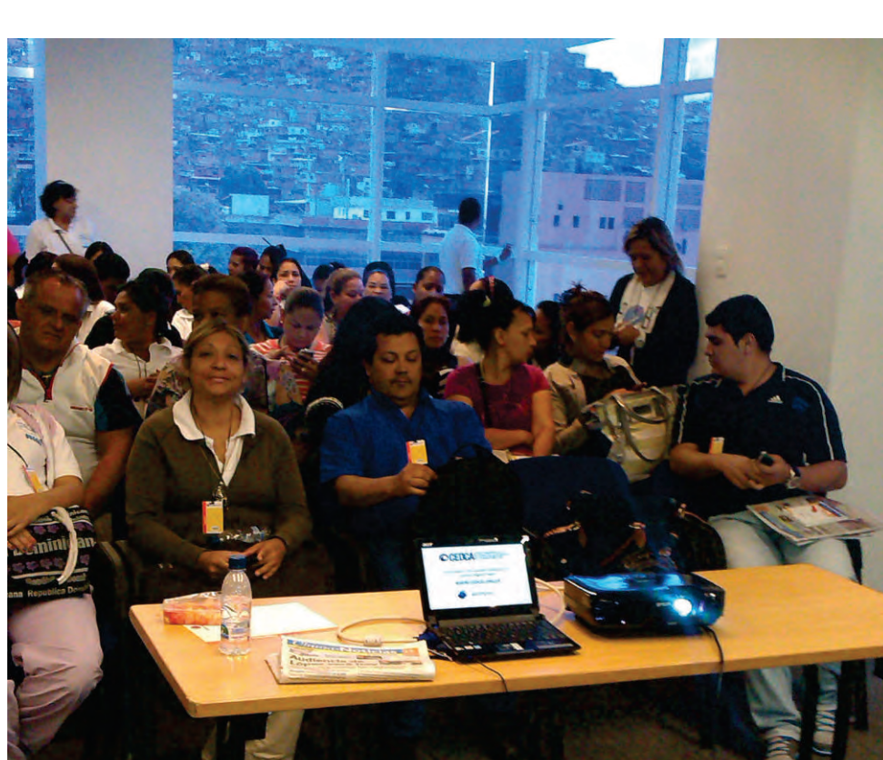
En la Cadena Capriles

Estas herramientas son muy pertinentes para promover la paz en nuestras escuelas alternativas y en la comunidad de Petare donde se encuentran.