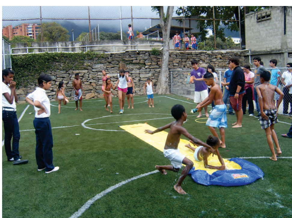
Ver fotos de la piscinada

Agradecemos todo el apoyo recibido en esta y futuras actividades que se realizan con el fin de motivar a los alumnos de OSCASI.