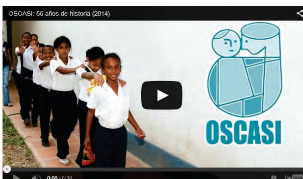
Ver video de los 56 años de OSCASI