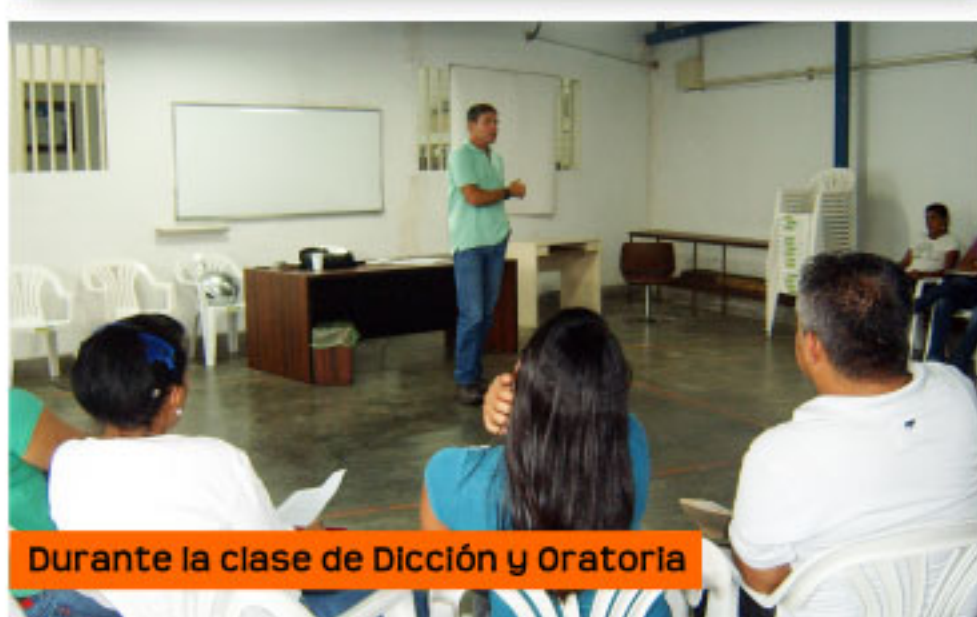
Durante la clase de Dicción y Oratoria