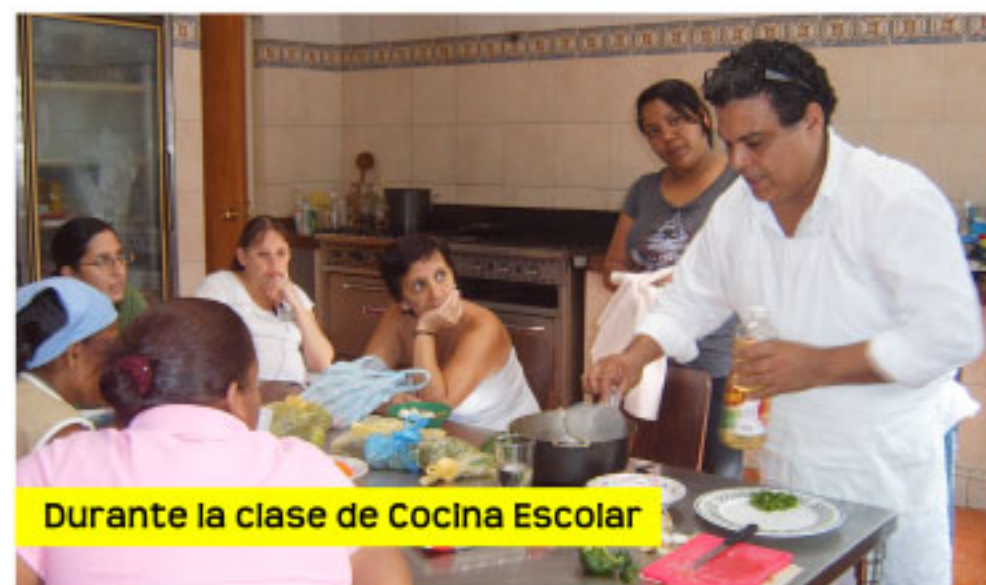
Durante la clase de Cocina Escolar

El Grupo CONVENEZUELA impartió un taller teórico-práctico sobre las manifestaciones navideñas venezolanas. Específicamente presentaron el Mono de Caicara (Edo Monagas), los Pastores de San Joaquín (Edo Carabobo) y (Zaragoza Edo Lara). Durante el taller, los asistentes profundizaron sus conocimientos sobre estas fiestas y además aprendieron a elaborar la indumentaria y la ejecución de los bailes tradicionales de estas localidades.