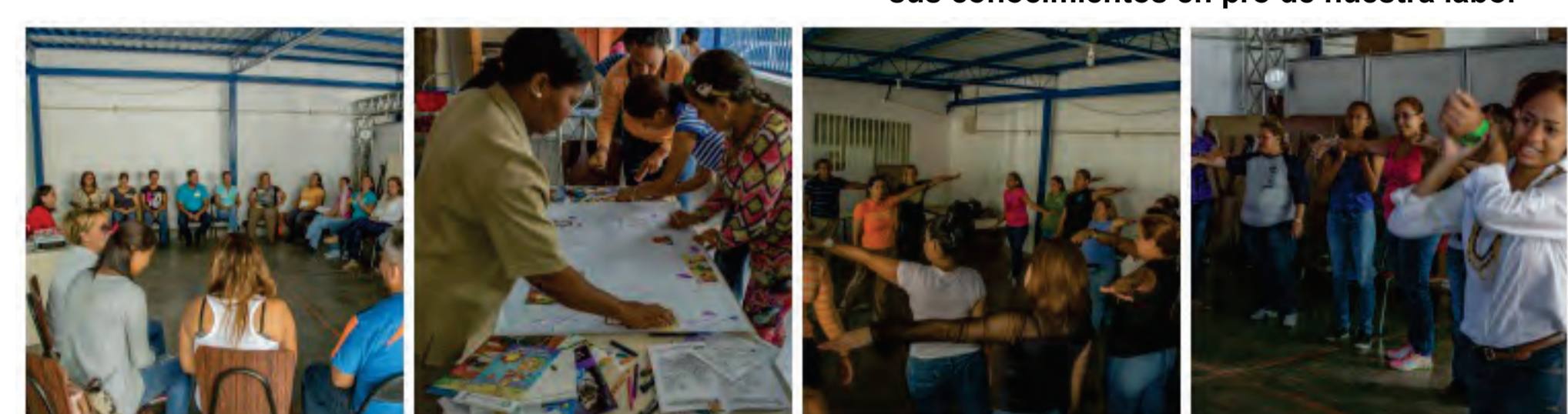
Ver fotos de las Jornadas de Capacitación en Facebook

Agradecemos a los facilitadores que participaron en las Jornadas de Capacitación para compartir sus conocimientos en pro de nuestra labor