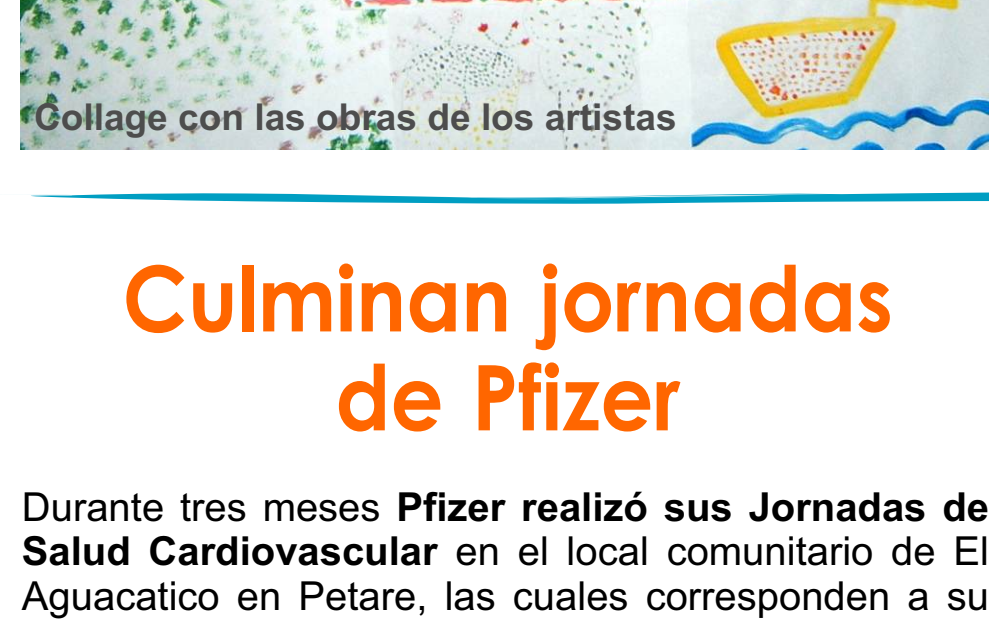
Gollage con las obras de los artistas

Cada uno plasmó su obra con témpera en papel y aunque el dibujo fue libre, predominó la temática navideña.